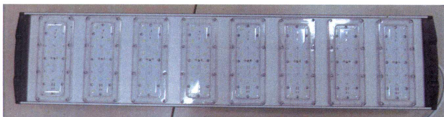
Светодиодный светильник Geliomaster GSF/GSFN-240